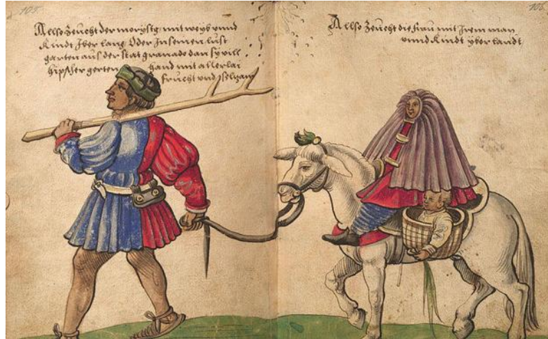
'Moriscos del reino de Granada, dando un paseo por el campo con mujeres y niños', un dibujo de Christoph Weiditz de 1529

territorio de la Corona de Castilla, cuya población morisca pasó de 20.000 a 100.000 personas. Por la gravedad y la intensidad de sus combates también se la conoce como la 'Guerra de las Alpujarras'. El historiador Henry Kamen la ha calificado como «la guerra más salvaje de las que hubo en Europa en aquella centuria». Según cuentan las crónicas de la época, el monarca de la Casa de Austria quedó sobrecogido ante las masacres de sacerdotes llevadas a cabo por los rebeldes. Aparte de las muertes y de las expulsiones, miles de ellos fueron vendidos como esclavos dentro de España. Así, por ejemplo, sólo en Córdoba, en 1573, había más de 1.500 esclavos moriscos.