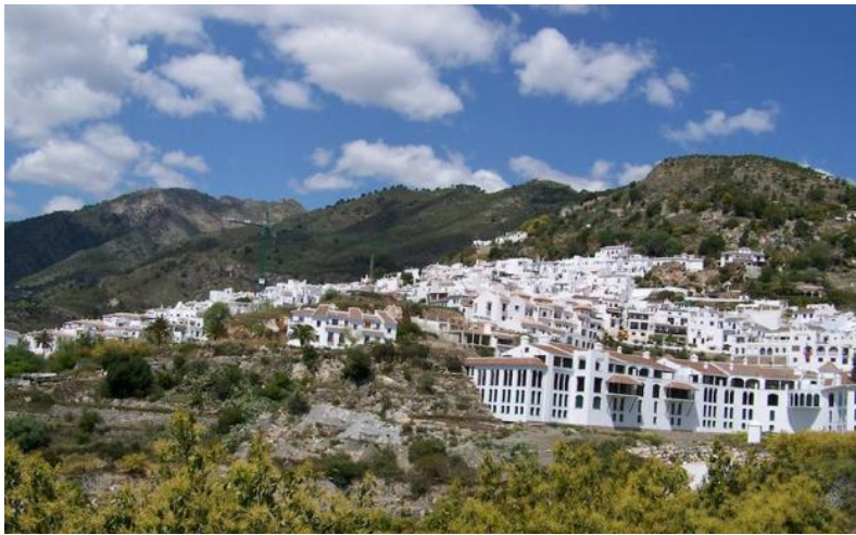
Vista del casco urbano de Frigiliana, con el Peñón del Fuerte al fondo.