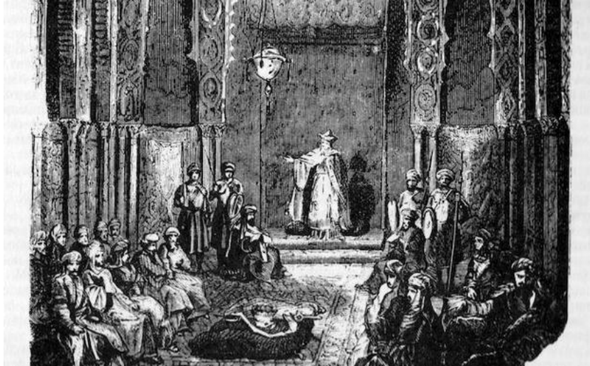
Elección de Aben Humeya como rey de los moriscos en la Rebelión de las Alpujarras, según un grabado de la novela 'Los Morfies de las Alpujarras' (1859), de Manuel Fernández y González.