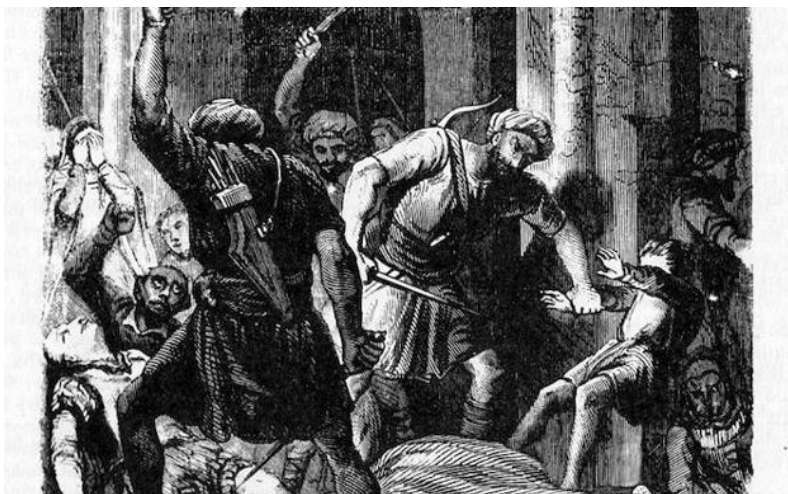
Degüello de cristianos en Cadiar, según un grabado de la novela 'Los Morfies de las Alpujarras' (1859), de Manuel Fernández y González.