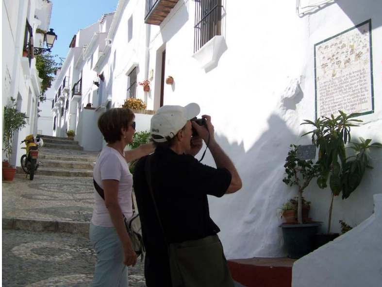
En el Barriarto de Frigiliana hay cerámicas con la historia de la Batalla del Peñón.

La guerra tuvo varias fases , aunque uno de sus capítulos más cruentos fue el episodio bélico que tuvo lugar en el Fuerte de Frigiliana, donde se cobijaron los moriscos de la sierra de Bentomiz. Por aquellos años esta comarca natural, que está comprendida hoy en los límites territoriales de la Axarquía de Málaga, incluía únicamente los pueblos de Cómpeta, las dos Canillas, Torrox, Nerja, Daimalos, Arenas, Sedella, Salares, Algarrobo, Sayalonga y Corumbela, entre otros, además de la propia Frigiliana.